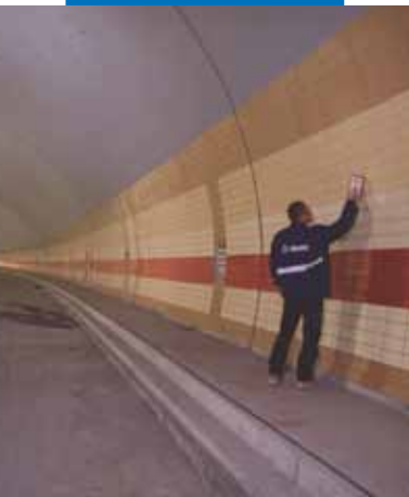
Mrázkova alagút - Prága - Cseh Köztársaság