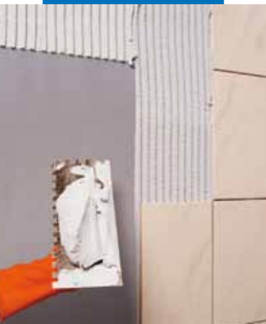
Mrázkova alagút - Prága - Cseh Köztársaság