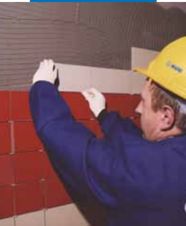
Kerámia burkolólap ragasztása falra

A túlagyúrt hézagok kitöltésére használjon az alkalmazáshoz illő MAPEI hézagkitöltőanyagot.