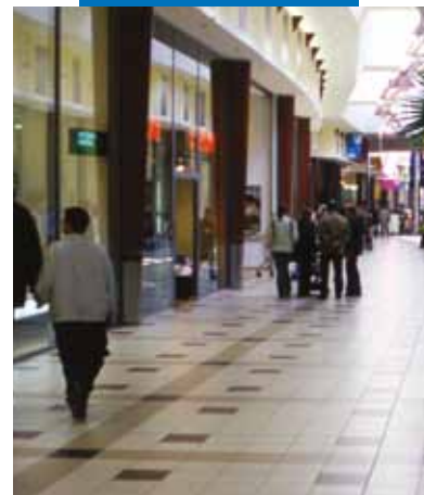
Kingcross Bevásárlóközpont - Zágráb - Horvátország