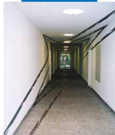
Allianz Irodaház - München - Németország