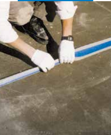
Példa terasz osztóhézagának tömitésére