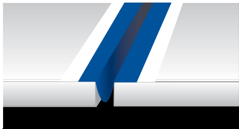
Mapeband omega formában elhelyezése mozgási hézagban