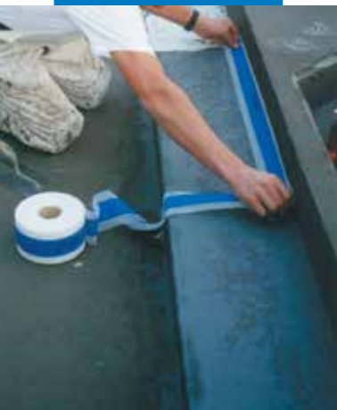
Példa fürdőmedence függőleges és vízszintes felületének csatlakozásánál lévő Mapeband-dal vízszigetelésére