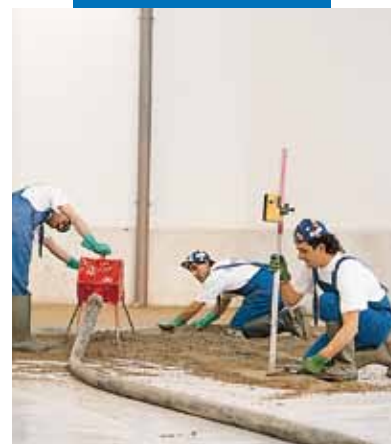
Topcem esztrich bedolgozása