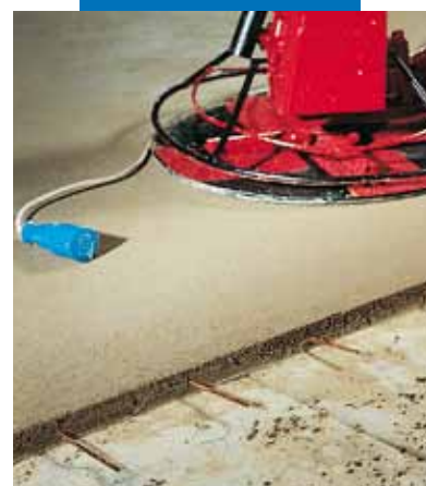
Topcem esztrich felületének gépi simítása