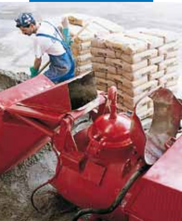
Topcem bekeverése automata esztrichkezővel