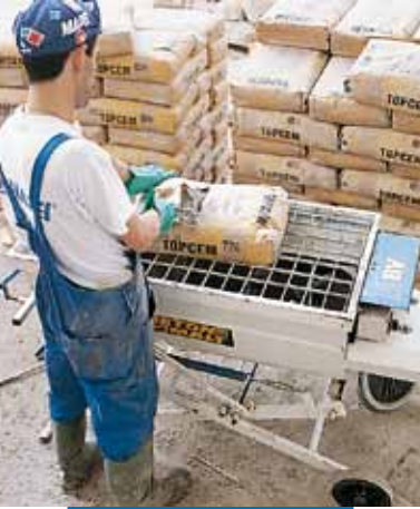
Topcem bekeverése csigás keverőgépben