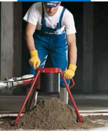
Topcem keverék adagolása