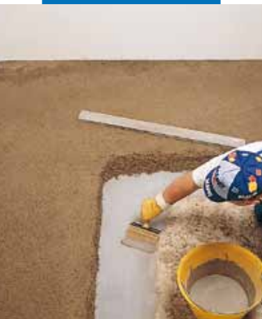
Tapadóhíd felhordása Topcem-mel készített kötött esztrich alá