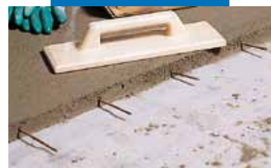
Acélrudakkal erősített Topcem esztrich részlete