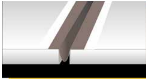
Mapeband PE 120 omega formában elhelyezése mozgási hézagban